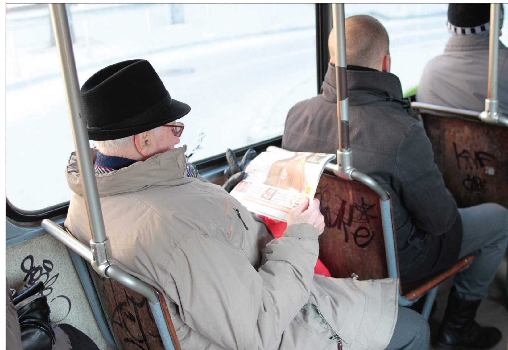
Pensionarii sunt cei mai fideli clienți ai RATT. Numărul lor este de aproximativ 45 de mii. Nici unul dintre ei nu plătește pentru plimbarea cu mijloacele de transport

"Ei și-au optimizat structura de personal, în sensul că au ajuns la un anumit echilibru între personalul direct, productiv și cel tehnico-administrativ, lucru pe care l-am cerut mai demult. Asta înseamnă că ei și-au redus cu vreo 500 de oameni efectivele. Am căutat să găsim un alt furnizor pentru energia electrică,