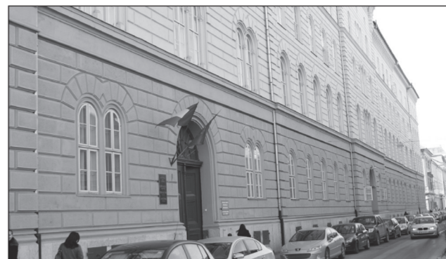
Unii magistrați din Palatul de Justiție au făcut averi colosale