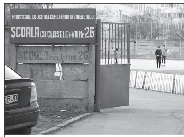
Comasările afectează unitățile școlare de la toate nivelurile

A doua comasare este cea a Colegiului Tehnic de Vest cu Colegiul Tehnic Minciu. Aici, deocamdată, probleme nu s-au anunțat la orizont, dar pot apărea în orice mo-