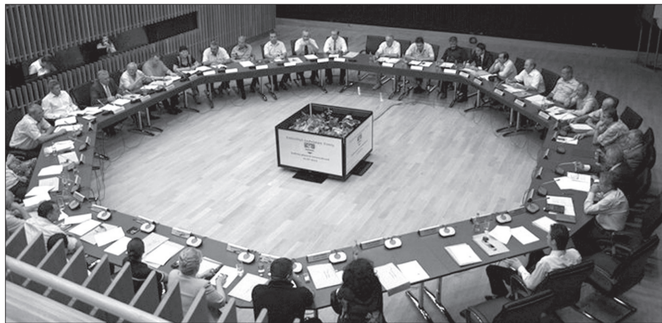
Consilierii județeni au votat bugetul pe anul 2012 și au împărțit cele mai mari sume pentru investiții

„Aproape ca anul trecut e bugetul din acest an, avem cam aceleași cifre pentru că am câștigat multe proiecte europene și practic, la sfârșitul anului, ați văzut, a existat un proiect de hotărâre prin care s-a repartizat excedentul de anul trecut. La sfârșitul anului trecut ne-au intrat banii pe care i-am cheltuit pe deponia ecologică, pe POS Mediu și acești bani au venit în ultimele zile, motiv pentru care a trebuit să repartizăm acest excedent în special către zona de investiții. Vreau să vă spun că anul trecut investițiile au fost realizate în proporție de 86-87%, este cel mai mare procent din istoria CJT, am făcut 190 de km de asfalt anul trecut și se vede în tot județul și