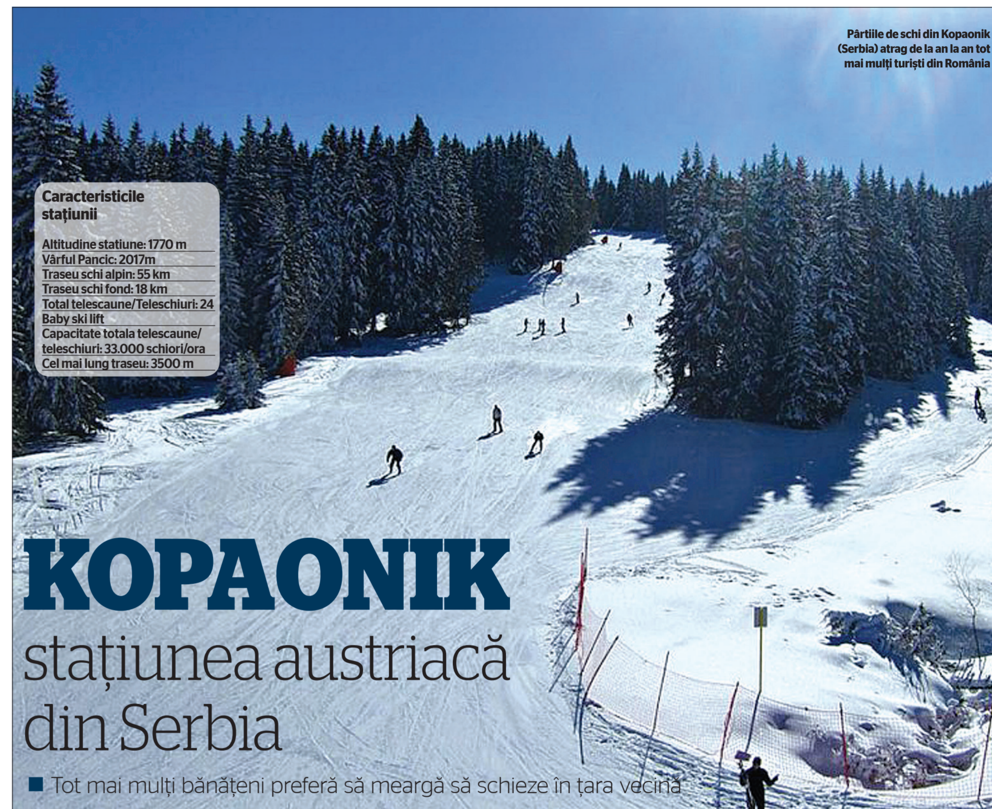
Părțile de schi din Kopaonik (Serbia) atrag de la an la an tot mai mulți turiști din România

10 Oferte pentru un Valentine's Day de neuitat pentru îndrăgostiți