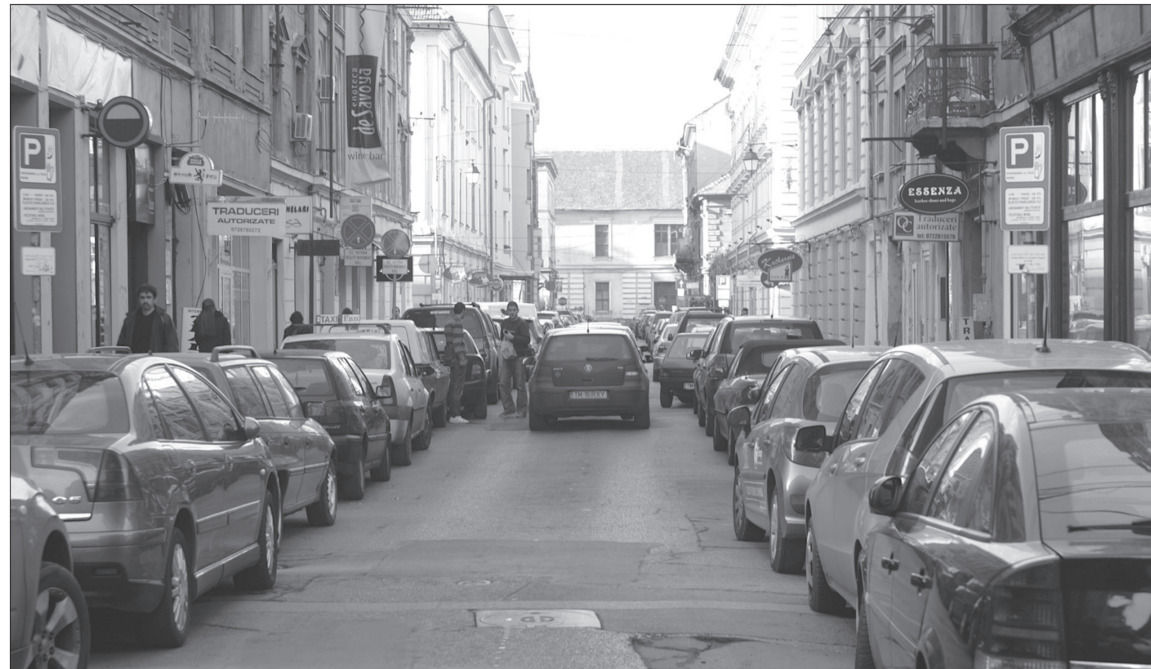
Din februarie, vom putea parca mai mult de două ore în zona centrală a orașului

„Eu mi-am permis ca în ședința de consiliu local din luna ianuarie să înaintez un proiect de hotărâre care să probeze următoarele: până la finele lucrărilor de reabilitare a zonei Cetate să fie suspendată aplicarea staționării limitate la două ore în zona centrală a municipiului Timișoara, mă refer la zona violet, în centrul istoric al orașului”, a declarat edilul-șef.