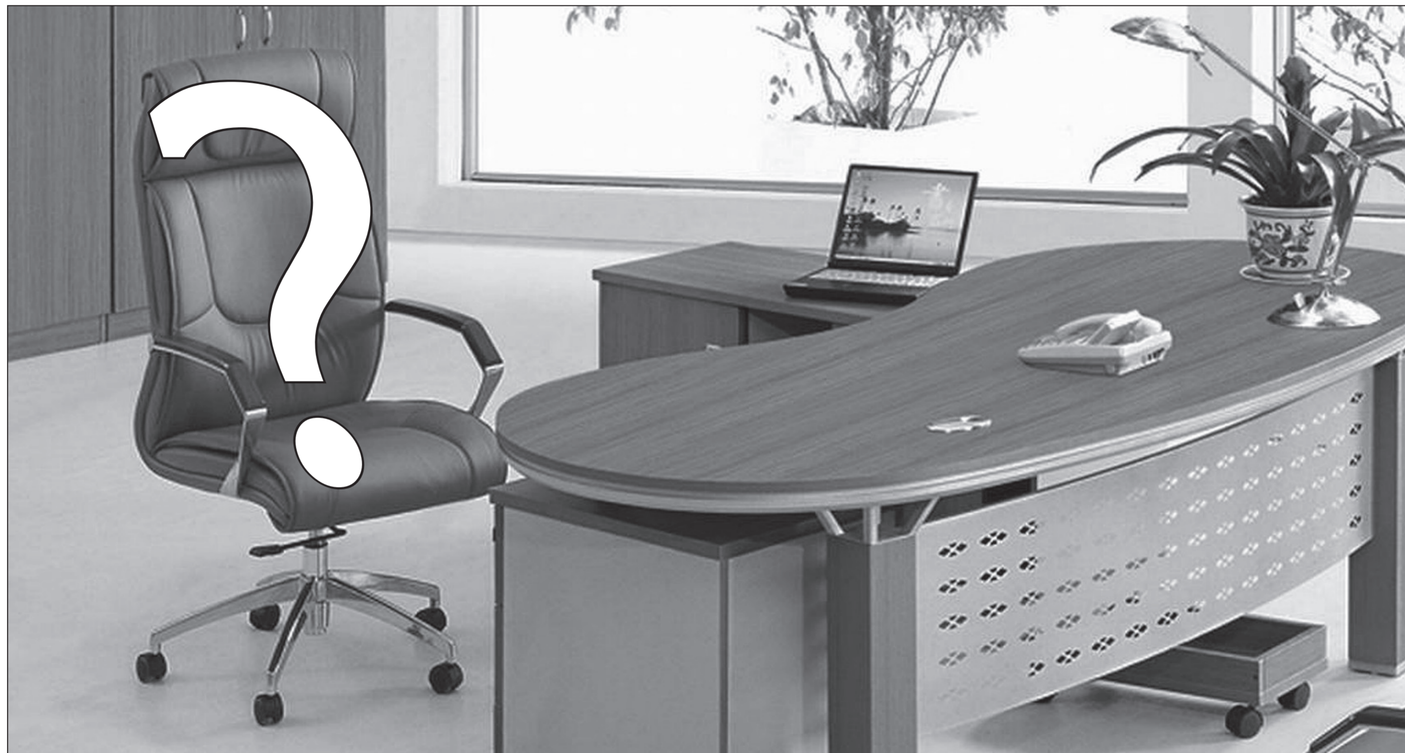
Numele celor care vor ocupa fotoliile de rectori la cele 4 universități de stat din Timișoara sunt sub semnul întrebării...