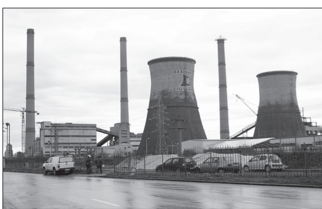
Cei mai mulți bani au fost atribuiți proiectului de rețehnologizare a societății de termoficare

Aleșii au împărțit cei mai mulți bani, 25,5 milioane de lei, pentru prefinan-