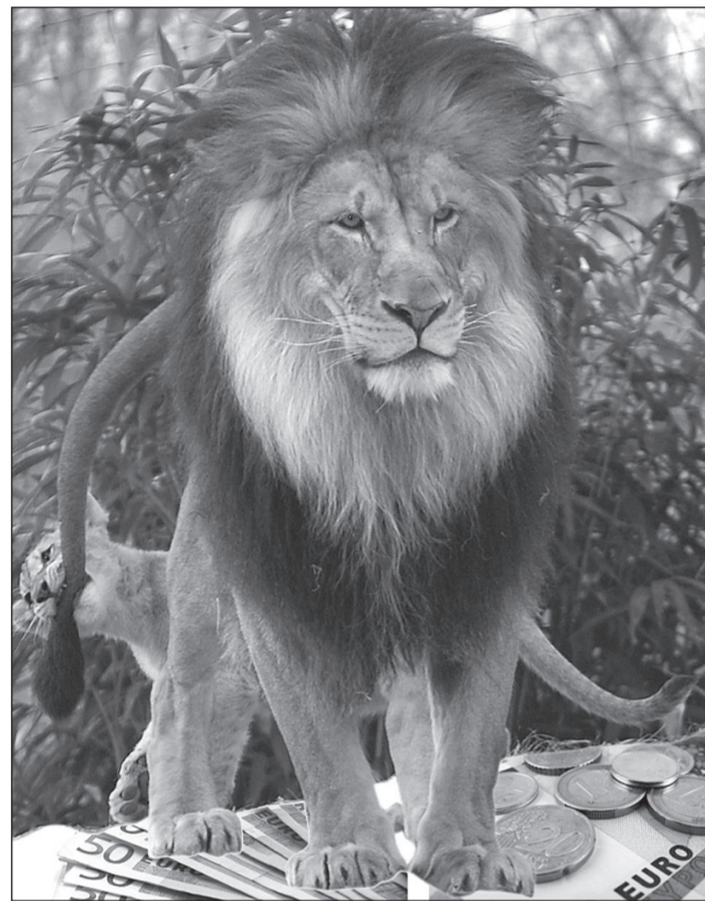
Leul a fost în 2011 cea mai stabilă monedă din zona non-euro

După ce statisticile au reluat faptul că, în trimestru trei al anului trecut, România a avut cea mai mare creștere economică din UE, respectiv 1,7%, depășind țări mult mai dezvoltate cum sunt Germania, Franța sau Italia, iar rata inflației din luna noiembrie, de 3,44%, a fost una dintre cele mai mici din ultimii 20 de ani, bilanțurile de sfârșit de an au mai adus o veste, care a confirmat, din nou, faptul că România este una dintre cele mai stabile țări din regiune. Mai exact, o analiză publicată de X-Trade Brokers în urmă cu câteva zile a demonstrat că, în 2011, leul a fost cea mai performantă monedă din această parte a Europei, cu o evoluție ce a "bătut" zlotul polonez, coroana cehă și forintul maghiar. Raportat la euro, leul a înregistrat un an de relativă stabilitate, deprecându-se cu doar 1,09%, în timp ce zlotul a pierdut 12,7%, forintul - 13,7%, iar coroana cehă - 2,2%. "Moneda noastră promite anul curaj, câștigând aproape 5% în intervalul ianuarie-aprilie, pe seama prognozelor economice îmbunătățite, anticipând ieșirea din recesiune, însă și-a pierdut elanul pe măsură ce percepția sa deteriorată din cauza crizei europene, cu epicentru în Grecia", a explicat directorul sucursalei din România a X-Trade Brokers,