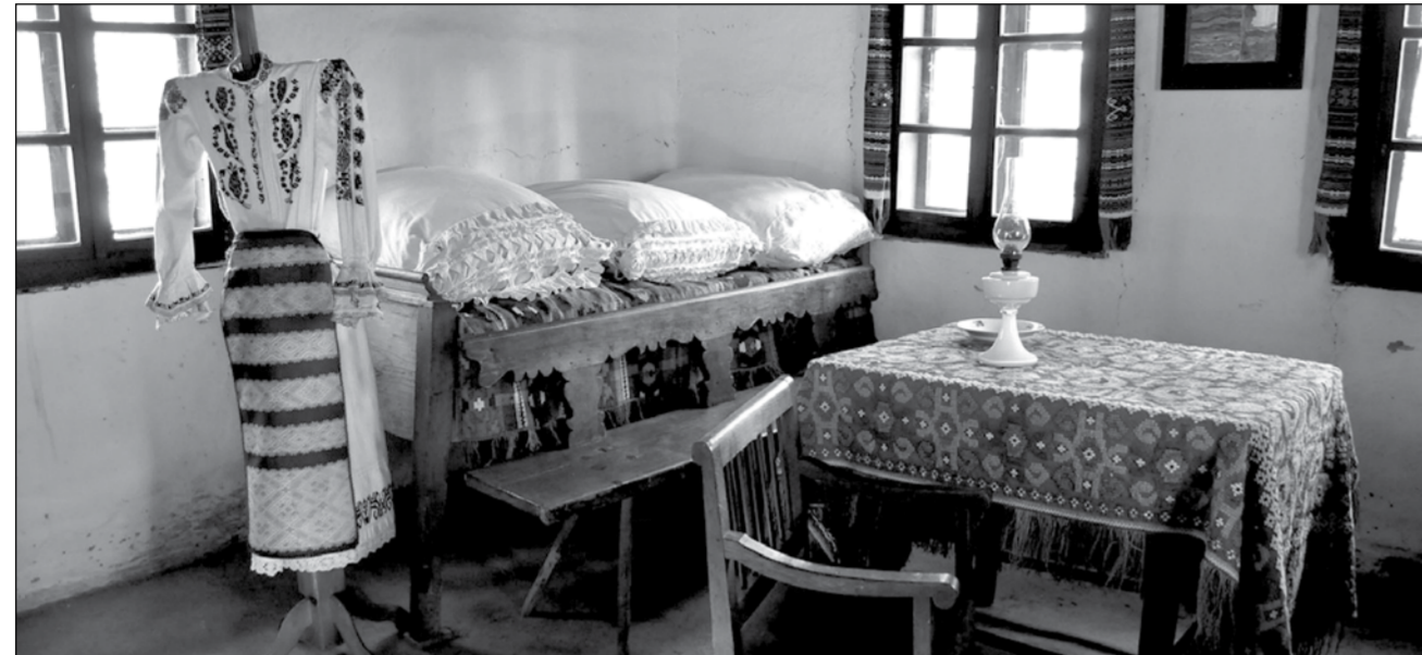
Consiliul Județean Timiș are proiecte pentru dezvoltarea turismului din zona Banatului

„Muzeul - Viu al Satului Bănățean” se numește proiectul pe care cei de la Consiliul Județean Timiș doresc să îl promoveze, cel mai probabil începând din primavara anului viitor. Turiștii vor fi îndemnați să calce pragul Muzeului pentru a vedea „pe viu” cum se trăia în urmă cu mulți ani, atunci când nu exista internet, televizor și nici măcar radio, când nu se folosea aragazul și nici cuptorul cu