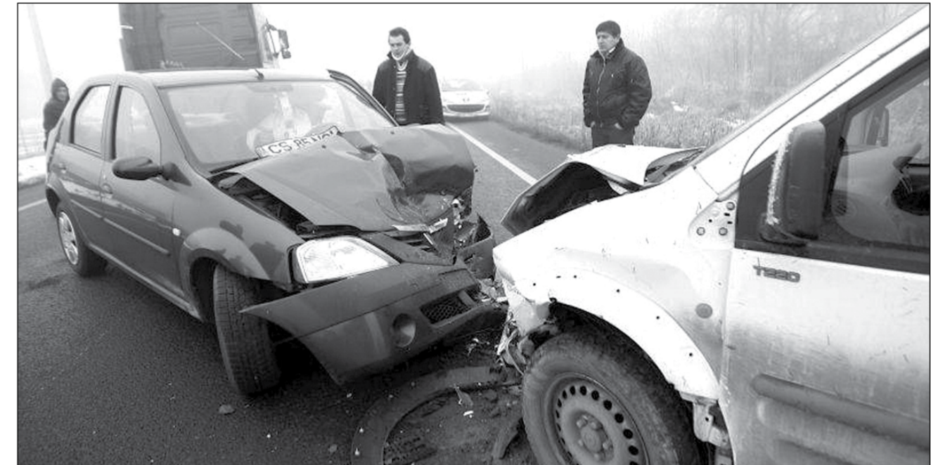
Deși au asigurări RCA valabile șoferii se pot trezi că trebuie să împartă cu asiguratorul daunele provocate în urma unui accident

După mai multe premii post-revoluționare, printre care și condamnarea unui medic la plata unor despăgubiri către pacientul său, instanțele de judecată din Timișoara sunt la un pas să schimbe jurisprudența și în materia litigiilor dintre deținătorii de asigurări auto și firmele de asigurări. Mai exact, unele sentințe pronunțate în ultima perioadă favorizează vizibil firmele de asigurări în dauna posesorilor de asigurări RCA, cei din urmă fiind puși în situația de a plăti despăgubiri de mii de euro în cazul unor coliziuni în trafic.