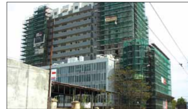
Fructus a devenit imobil de birouri și locuințe