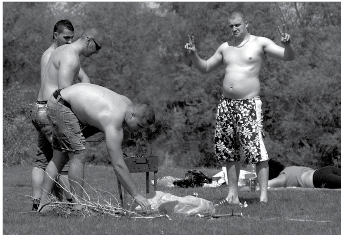
Grătarele sfârșite la Șag pe acorduri de manele, printre plășuțe, gunoaie și doze de bere

„Spre surprinderea mea e mai curat ca în alți ani, chiar dacă e mai multă lume. Am început și noi să ne civilizăm, în felul acesta la Pădurea Verde”, mai spune timișoreanul. Dacă nu vreți să mergeți la Pădurea Verde, o zi de 1 Mai se poate desfășura în Parcul Bihor din spatele fostului Abator. Special creat pentru a fi un parc de picnic, în acest loc îți este interzis să faci focul și implicit să prăjești apripoare, miți sau piept de pui la grătar. Poți însă să-ți aduci de acasă un coșuleț unde să-ți pui un sandwich și chiar să te așezi pe iarbă dacă ai o pătură. Important este să nu distrugi spațiul verde. Poliștii locali veghează la buna administrare a parcului și fiecare încercare de distrugere se amendează drastic