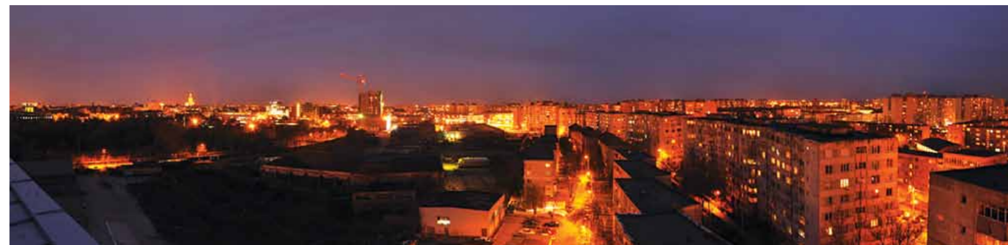
Timișoara, un oraș așezat pe o fostă mlaștină, în prezent fără probleme majore cu insectele

Cum se reciclează hârtia Hârtia, cu excepția documentelor care trebuie să fie tocate din rațiuni de confidențialitate, este bine să fie lăsată întregă, presată și nemototolită. Se pot recicla consumabile, hârtia de imprimantă, caiete, agende, plicuri, sau ziare, reviste, materiale promoționale, etc. Nu se pot recicla: hârtia igienică, șervețelele, batistele de unică folosință, sau hârtia ori cartonul care a ajuns în contact cu mâncarea.