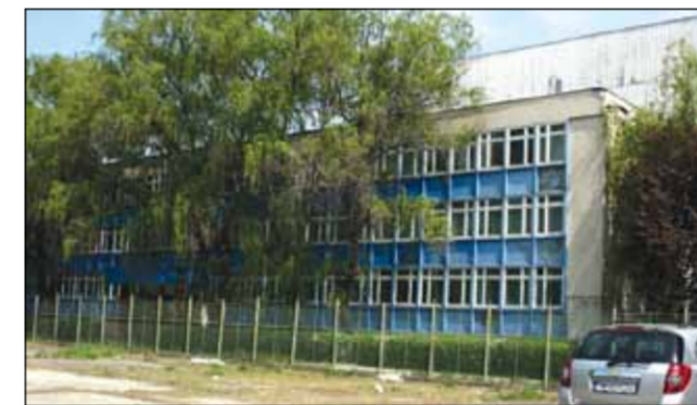
La fabrica unde se producea Lăstunul bate acum vântul