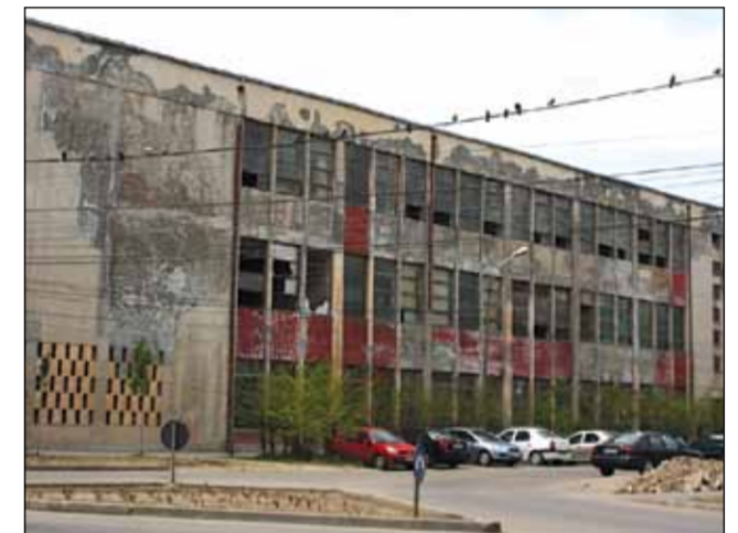
Terenul de aproape 10.000 de metri pătrați de la fosta Kandia este evaluat la peste cinci milioane de euro

Deși cele două fabrici dețineau, împreună, o cotă de 40% din piața românească de ciocolată, proprietarul Fathi Taher a hotărât închiderea unității de la Timișoara și transferarea la București a principalelor mărci fabricate în Banat.