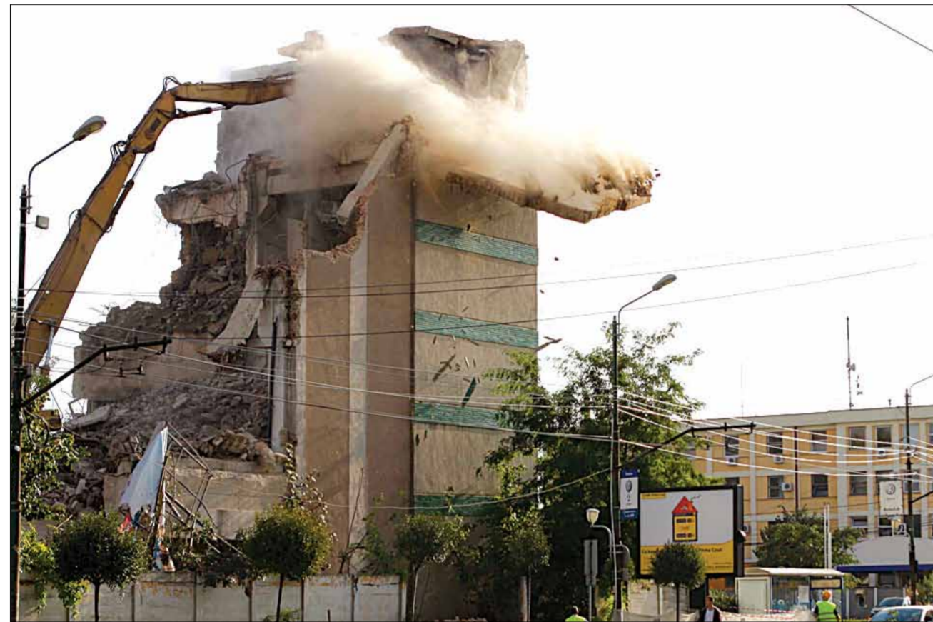
Fosta fabrică Industria Lânii a fost demolată complet în toamna anului trecut

Între timp, din 1948 și până în 1990, societatea a fost în proprietatea statului, iar din 1990 a devenit proprietate privată, procesul fiind finalizat în 1995. Activitatea a continuat la fabrică, deși în alte condiții, s-a deschis și un magazin de prezentare la parterul imobilului de pe bd.Republicii. În 2006 însă, au apărut primele scandaluri între sindicat și Consiliul de Administrație al fa-