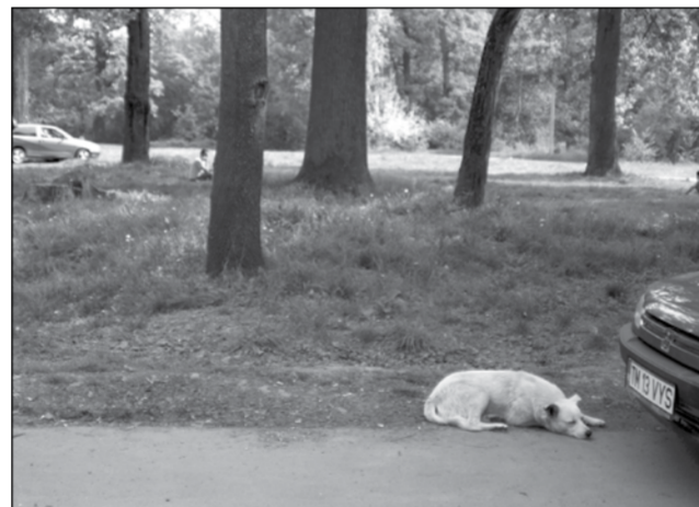
Câinii comunitari se relaxează după o masă sănătoasă