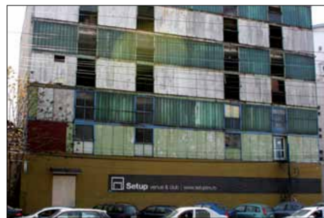
În vechile uzine de pe strada Pestalozzi (stânga) și de pe Bulevardul Republicii s-au deschis cluburi