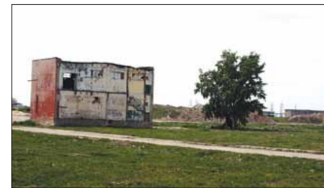
În locul fabricii Dermatina a rămas un teren viran