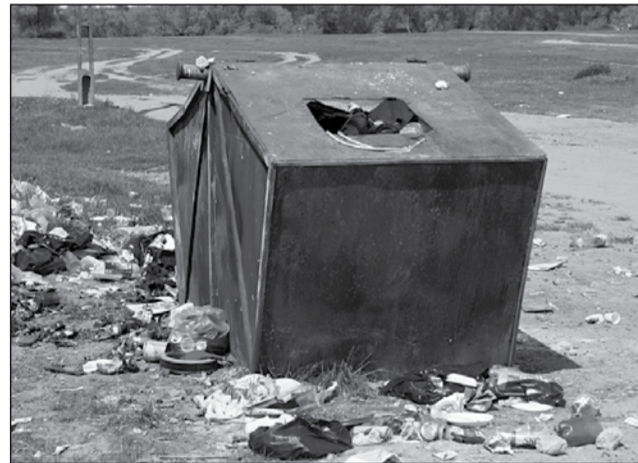
La Șag te întâmpină un container din care se revarsă gunoaiete