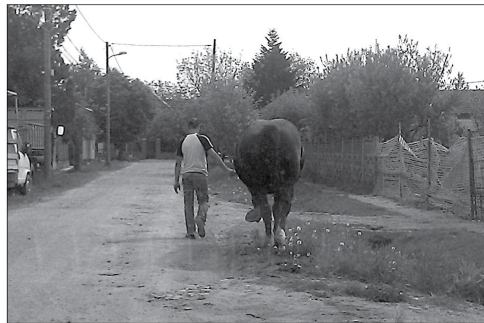
Pe strada Anvers, un timișorean și-a scos calul la plimbare