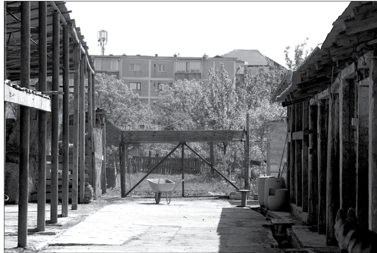
În grajduri, o familie a crescut 40 de vaci în cartierul Mehala

Purtător de cuvânt la Poliția Locală, crescătorii de cai au primit amenzi pentru că aveau 20 de cai în curte. „Au fost sancționați de mai multe ori, dar numărul cailor era mai mic ultima dată când am fost în control. Au primit și somații de la mediu, dar de multe ori nu i-am găsit acasă și le-am lăsat somații să meargă la Garda de Mediu. Le-am dat șase sancțiuni și patru somații anul trecut”, ne-a