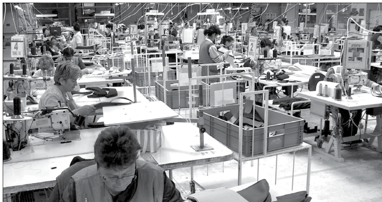
Sindicaliștii se tem că petronii nu vor mai angaja muncitori pe perioadă nedeterminată.

Sindicatul fac proteste ample în toată țara, din cauza prevederilor noului Cod al Muncii, pentru care guvernul Boc și-a asumat răspunderea. Cea mai criticată dintre normele noului Cod este majorarea la 3 ani a perioadei pentru care se poate încheia un contract pe durată determinată. În plus, se introduce posibilitatea prelungirii contractului fără limită de număr al prelungirilor și fără limită ca durată a perioadei de prelungire. Mai mult, se elimină obligativitatea patronului de a-1 angaja pe salariat cu contract pe durată nedeterminată după 3 contracte pe durată determinată. Sindicaliștii sunt siguri că vechiul contract de muncă pe perioadă nedeterminată va dispărea, iar majoritatea salariaților vor fi angajați cu contract pe perioadă determinată. În acest fel va dispărea complet siguranța și protecția locului de muncă. Salariații nu vor mai primi plăți compensatorii și mai ales nu vor mai putea face credite pe perioade lungi.