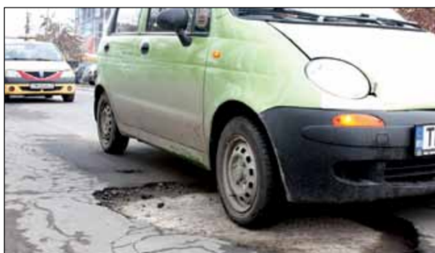
Drumurile municipale arată ca ulițele rurale