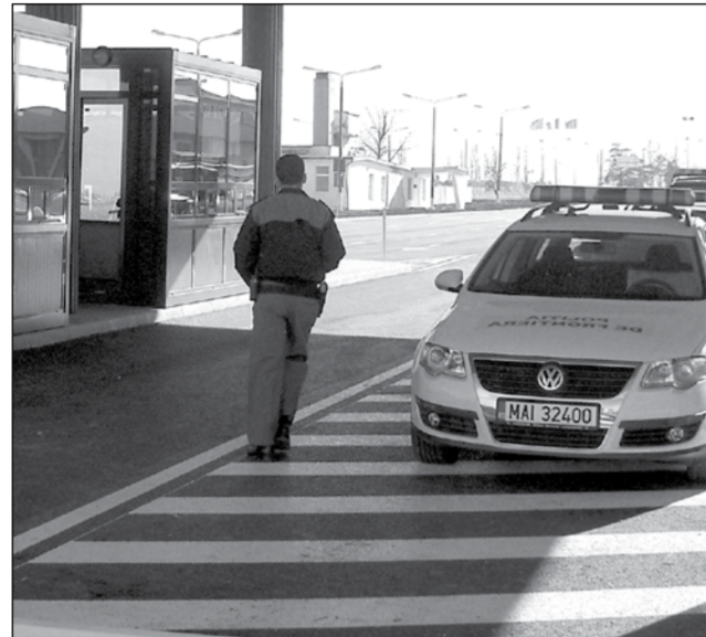
Traficul cu țigări continuă la vămile din vestul țării

Un agent al poliției de frontieră este suspectat că ar fi scos din vamă câteva baxuri de țigări de contrabandă, în timp ce era de serviciu în punctul de trecere al frontierei de la Moravița și le-ar fi predat unui complice aflat în afara vămii. În momentul în care a fost declanșată cercetarea prealabilă împotriva sa, subofițerul a demisionat din poliția de frontieră și va pleca la muncă în U.E. Împotriva colegului său, ancheta administrativă este în plină desfășurare.