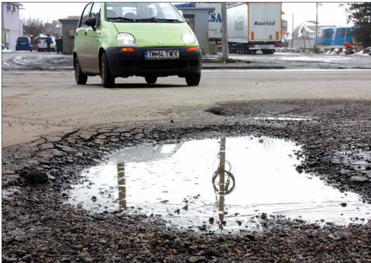
Numărul celor care se îndreaptă împotriva primăriei pentru recuperarea daunelor crește în fiecare an.

Și cei care nu au o asigurare Casco au șanse să își recupereze banii, însă aceștia au nevoie, în special, de ajutorul agenților de la ru-tieră, ca să dovedească prejudiciul, adică să obțină un proces verbal de constatare în care să se menționeze că starea proastă a drumului este cauza principală a prejudiciului.