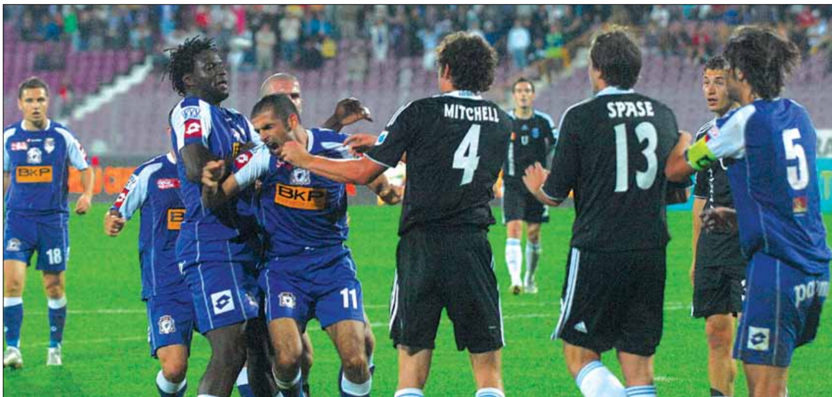
Din infruntările dintre Poli și Craiova au ieșit întotdeauna scânteli...

PEȘTI Te copleșește dragostea și acest lucru te va face să regreti că nu ți-ai făcut mai mult timp și în trecut pentru a încerca mai des aceste sentimente. Până la urmă se va dovedi că săptămâna aceasta este favorabilă realizării pe plan social și material. Găsește-ți ceva timp dacă nu pentru odihnă, mișcare pentru o activitate care să-ți permită să te relaxezi. Atât timp cât nimeni nu renunță la gândirea pozitivă și îi încurajează pe ceilalți, ritmul de înaintare al acestor planuri va fi unul foarte bun. Din păcate proiectele pentru timpul liber îți vor fi date peste cap și acest lucru ți-ar putea aduce discuții cu partenerul de suflet.