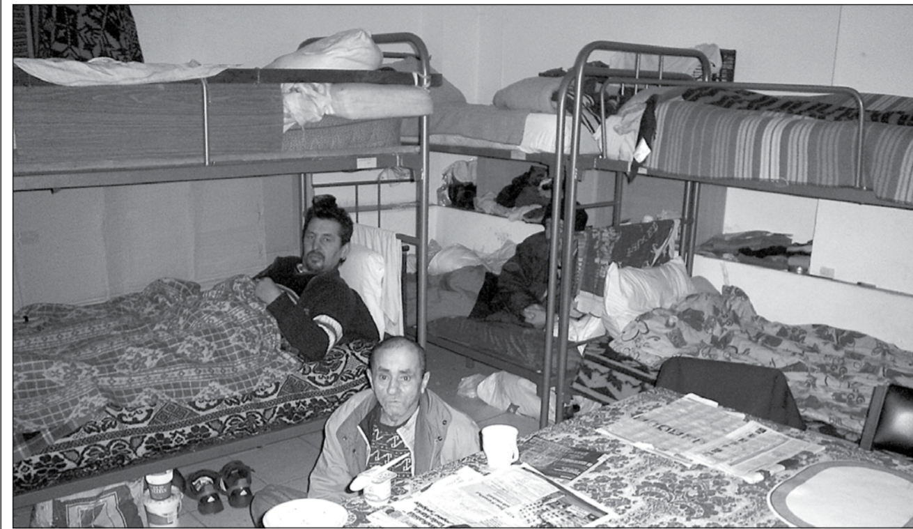
In „salioanele” Fundației Timișoara '89 sunt internate 23 de persoane care nu au posibilități financiare pentru a se trata singure

Unicul așezământ de acest gen din țară este la sediul Fundației Timișoara '89