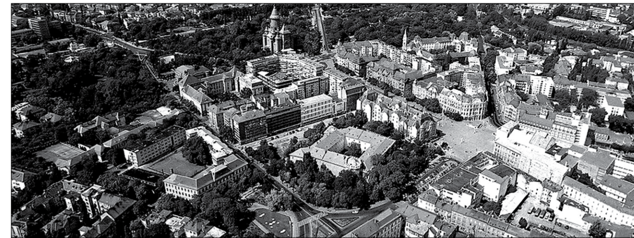
Timișoara ar putea deveni Capitală Culturală Europeană în anul 2020

Nu s-au spetit foarte mult să promoveze orașul pentru că... se promovează singur, doar îi avem pe Herta Muller sau pe Ioan Holender, care au deja imagine bună peste hotare. Într-un târziu, autoritățile noastre locale au avut o primă întâlnire chiar în această săptămână, ocazie cu care au pus la cale un plan pentru susținerea Timișoarei în cadrul competiției naționale. Optimiști, cei de la Primărie, dar și Ioan Garboni, direc-