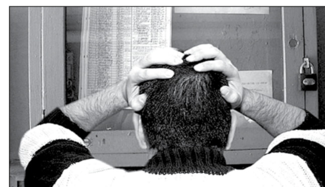
Recordul absolut la restanțe este de 8.300 de lei pentru 5 luni

lei în plus, pentru a acoperi diferența dintre prețul aprobat de consiliul local și prețul mai mic care a fost facturat mai multe luni pentru că prețul a atacat în contencios administrativ actul normativ care stabilea tarifele la energia termică. Un exemplu clar în acest sens este un apartament din zona centrală, de pe pe bule-