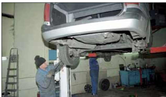
"Diagnosticul" este stabilit de un mecanic autorizat