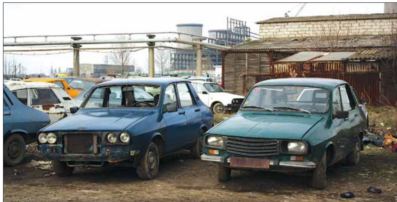
Rabilele așteaptă să fie înlocuite în trafic cu autovehiculele noi

În primele trei luni ale lui 2011, de când s-a dat startul înscrierilor pentru programul Rabla, aproximativ 100 de persoane din județul Timiș au depus cereri pentru a-și achiziționa un autoturism nou. Ministerul Mediului a anunțat că în 15 martie se vor anunța oficial locațiile exacte ale centrelor de colectare a rablelor și de emitere a tichetelor valorice. Până atunci, toți cei care doresc să beneficieze de acest program, își pot căuta un model nou de autoturism, la unul dintre showroom-urile autorizate, unde vor plăti un accont de 2.000 lei, pentru orice model. „Condițiile vor fi aceleași ca și anul trecut. Autovehiculul să aibă peste 10 ani vechime și să fie în stare funcțională, iar valoarea unui tichet este tot de 3.800 lei”, spune Daniel Ștefan, consultant vânzări, la Auto Europa. La fel rămâne și situația tichetelor care pot fi vândute. Pentru achizițio-