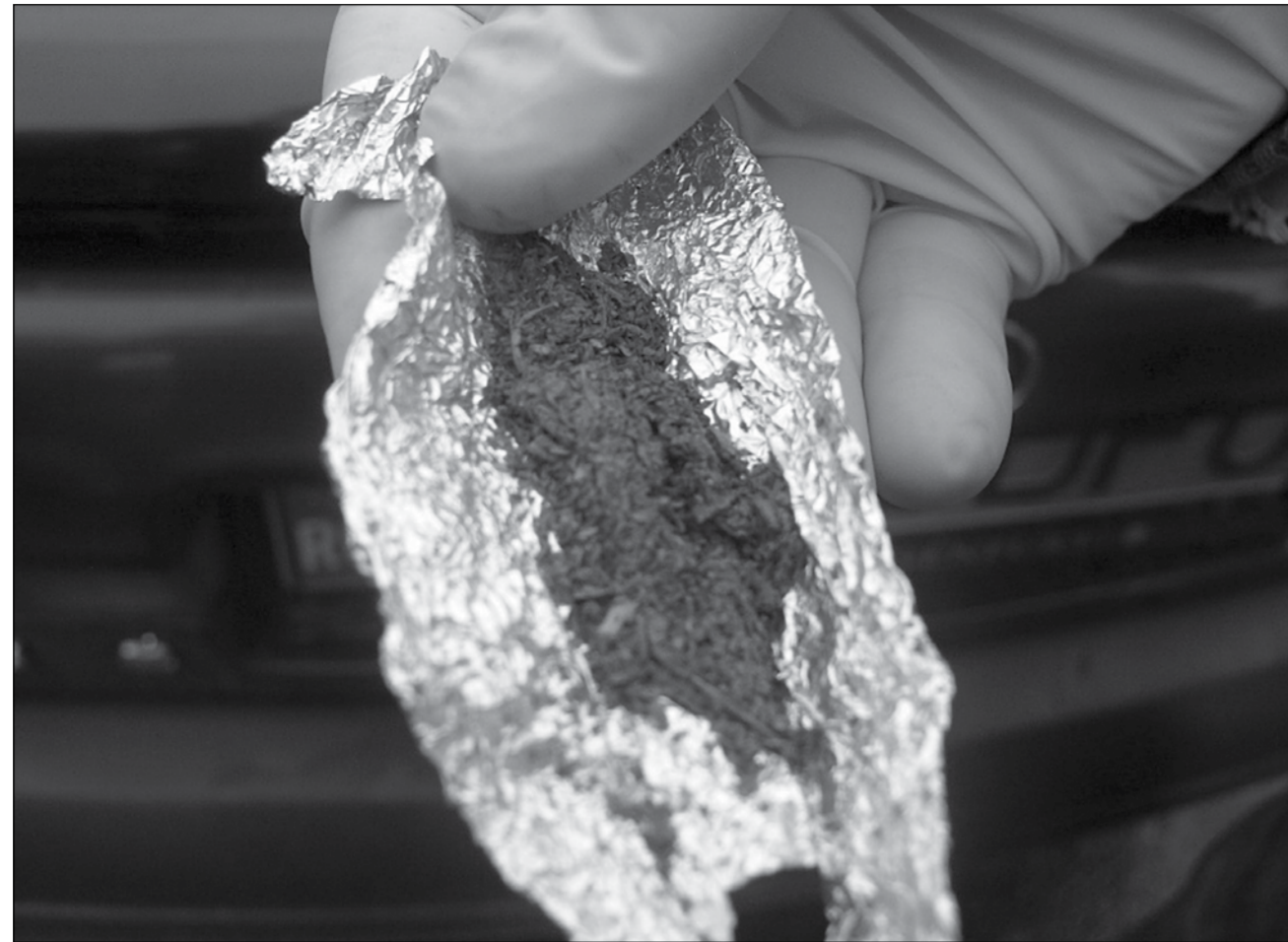
Substanțele etnobotanice sunt mult mai periculoase decât așa-numitele droguri ușoare (cannabis sau hash)

Potrivit datelor oficiale, doar la nivelul județului Timiș au fost înregistrate 4 decese anul trecut cauzate de efectele extreme ale acestor substanțe. "Din discuțiile pe care le-am avut și cu cei care au consumat etnobotanice, dar și cannabis am ajuns la o concluzie incredibilă: efectele acestor substanțe sunt foarte dure într-un timp foarte scurt. Spre exemplu,