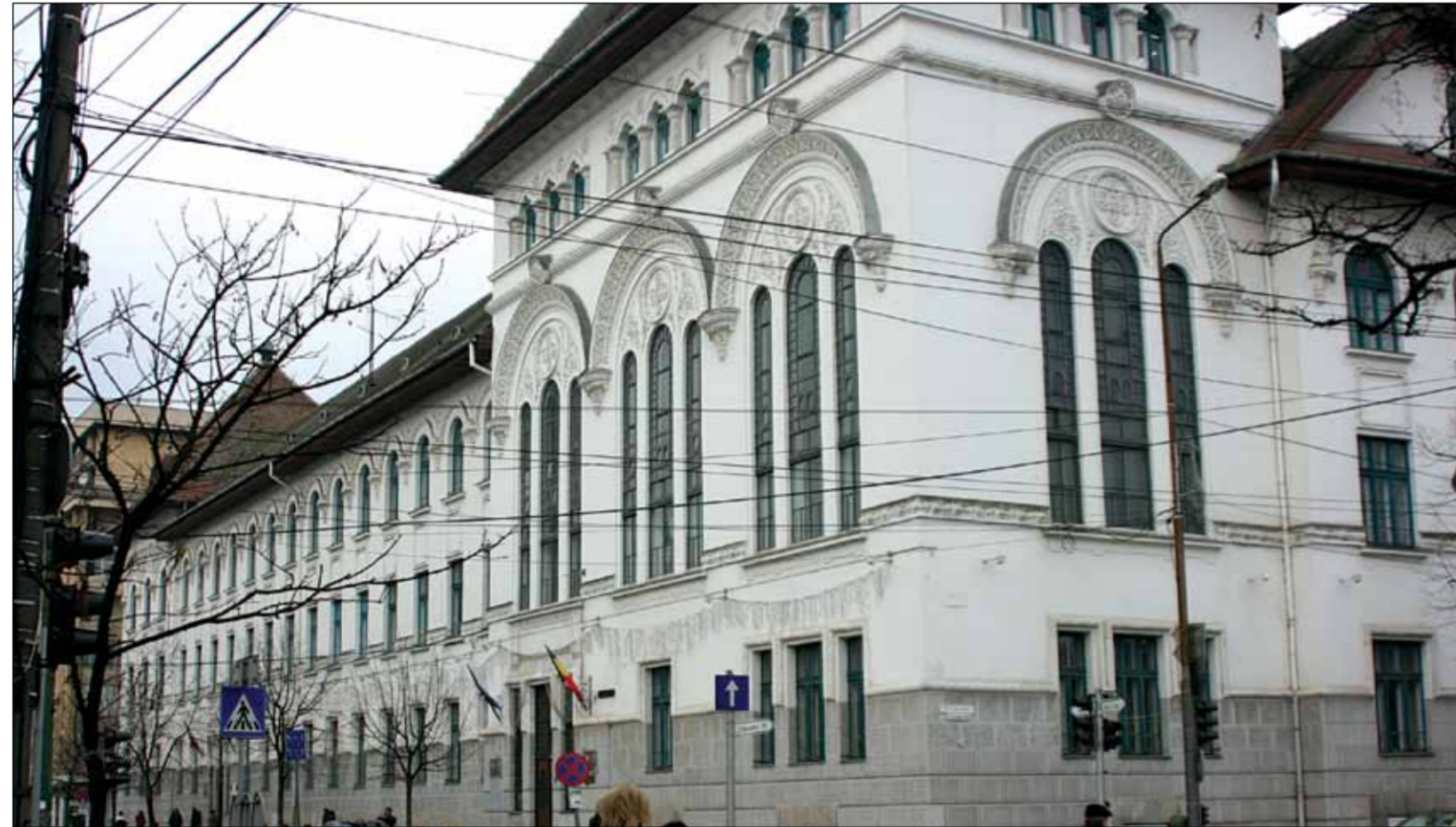
Primăria Timișoara a fost zguduită de scandaluri, iscate de nemulțumirile unor angajați față de conducerea instituției

Fostul arhitect-șef al urbei spune că nici acum, de la atâția ani de la plecarea sa din primărie, proiectele sale nu sunt bătute în seamă. „Eu am dat studii apreciate în străinătate, care acolo sunt bune, dar în primărie zac prin sertare. Eu nu mă duc să sărut mâna onora care mi-au făcut ce mi-au făcut ei, ca să îmi fie luată în seamă munca. Vă pot spune un singur lucru: nimeni nu te poate face să comiți o ilegalitate, dacă tu nu dorești, astfel că cei care con-