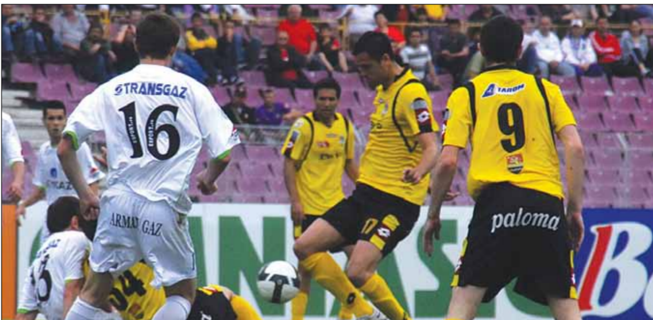
În tur, poli a reușit doar un egal în fața celor de la Gaz Metan Mediaș

La nivel declarativ, nici campioana „en titre”, CFR Cluj, nu a renunțat la primul loc, deși este cea mai slab clasată dintre favorite. Reprezentantele capitalei, chiar dacă au ca alternativă și Cupa României pentru a întrerupe seria neagră de sezoane fără trofeu, sunt disperate să-și recâștige suporterii după dezamăgirile din prima parte a stagiunii, în timp ce liderul a prins destul tupeu încât să dea în continuare dureri de cap rivalore. Va fi o luptă pe toate fronturile, prin toate