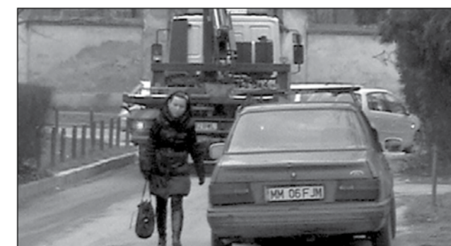
Neatenția ADP și a Poliției Locale a dus la o situație penibilă: preotul din Covaci și-a recuperat mașina și copilul din depozitul ADP

A doua zi, marți dimineața, primarul și viceprimarul Timișoarei au susținut că ceea ce s-a întâmplat a fost o mare rușine. “E o situație neplăcută dacă s-a întâmplat așa. Eu am mai spus că lucrurile astea trebuie să se facă cu foarte mare grijă. Știu că este neplăcut să îți se ridice mașina și dacă este o situație de genul asta, cu atât mai penibil”, a