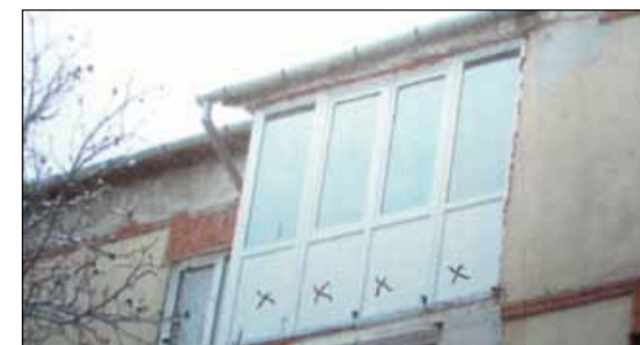
Termpanele au ajuns și la apartamentul profesoarei de sport