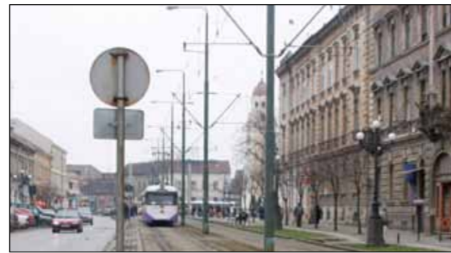
Pe Bulevardul Tinereții a dispărut esplanada