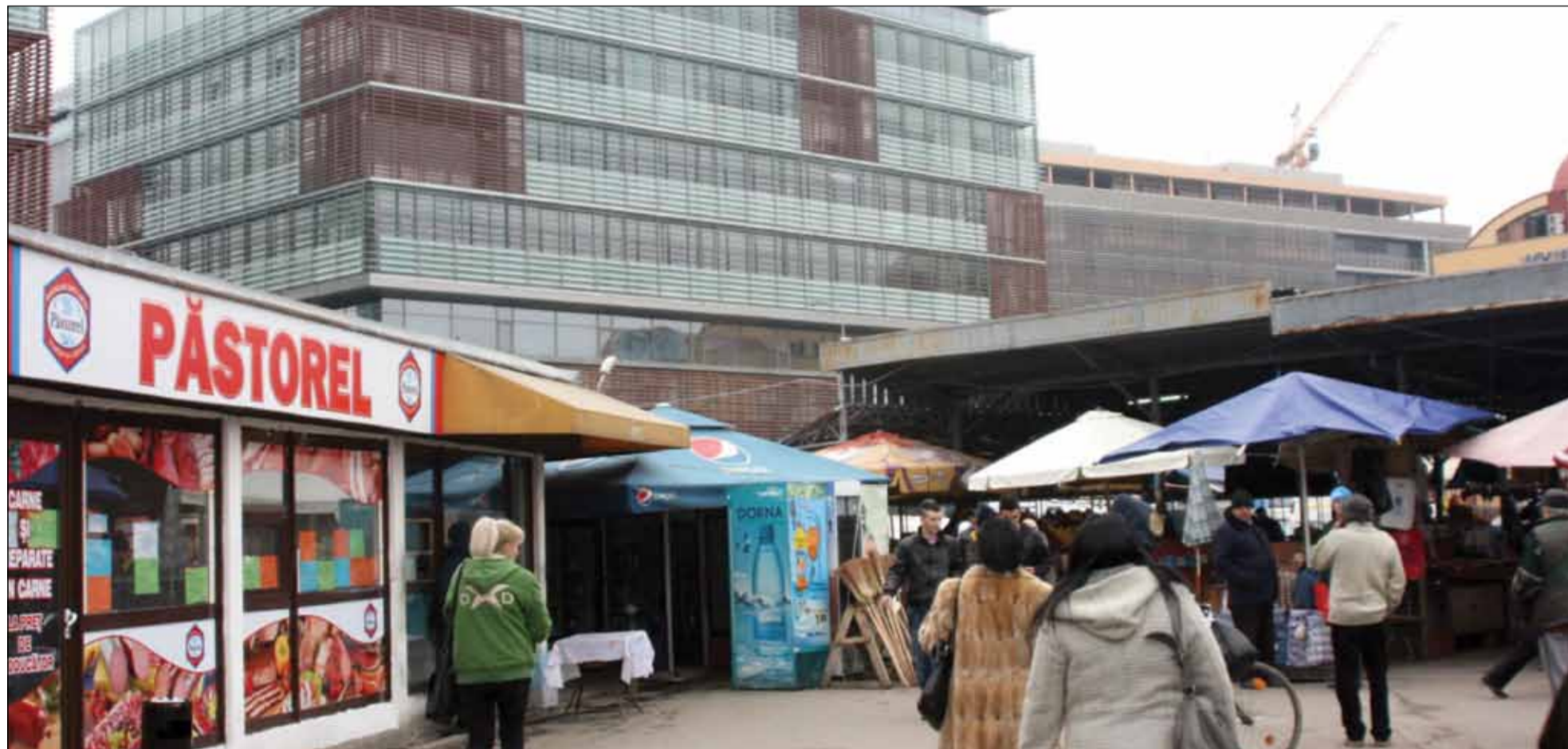
În Piața 700 clădirile de birouri de lux se îmbină nefericit cu buticurile și piața agro-alimentară spre disperarea arhitecților