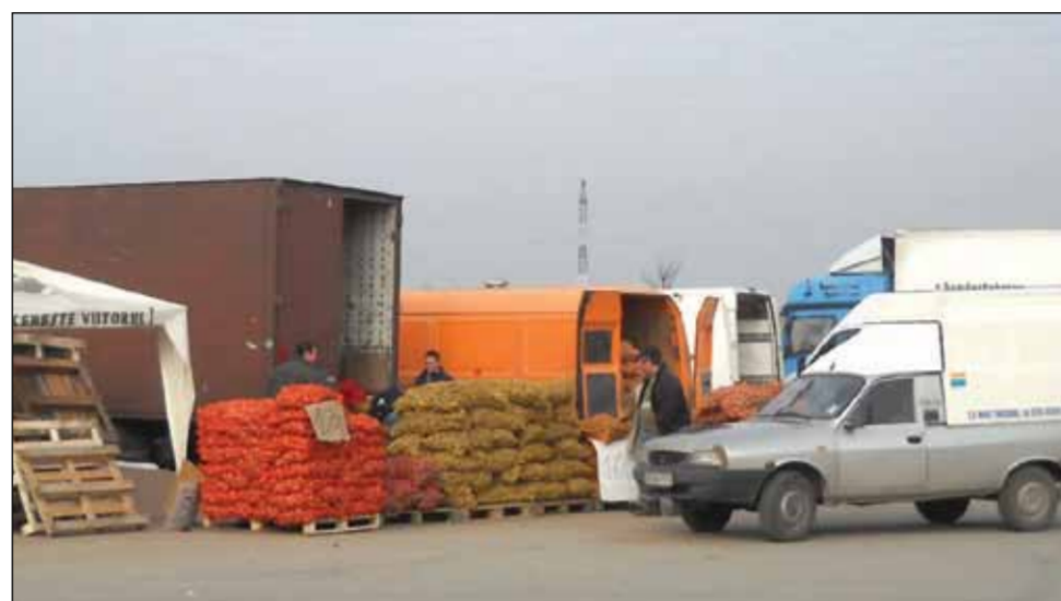
Suspecții au fost transportați la București cu elicopterul pentru anchetă

„E la mîntea prostului că merele, cartofii spălați și aranjați pe mărimi, ceapa sau salata nu pot fi de la producătorii autohtoni. Comisarii de la gardă și inspectorii de la piete știu, dar nu mișcă un deget. Probabil știu ei de ce, astfel că bișnițarii fac comerț la liber cu marfă de contrabandă. De când i-a săltat pe vameși de la Moravița, s-au schimbat și metodele de contrabandă. Dacă până pe la sfârșitul lui ianuarie TIR-uri-