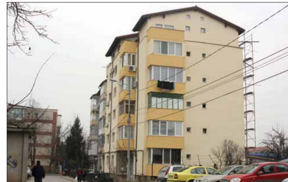
Construcții care mansardează blocuri nu vor mai fi nevoiți să le și reabiliteze termic

Potrivit hotărârii aprobate în 2007, "pot fi mansardate, fără rezerve, clădirile existente, cu cel mult P+4E, prevăzute cu cel puțin un lift pe scară, chiar în situația în care liftul nu va deservi și ultimul nivel. Mansarda fiind o formă de reabilitare termică a clădirii, proiectul pentru autorizarea executării lucrărilor de construcții va trata în întregime reabilitarea termică a clădirii și întregul aspect arhitectural al imobilului. Clădirile existente P+4E, pot fi mansardate fără rezerve în cazul realizării, prin extinderea pe verticală a apartamentelor de la etajul IV, obținându-se apartamente tip duplex,