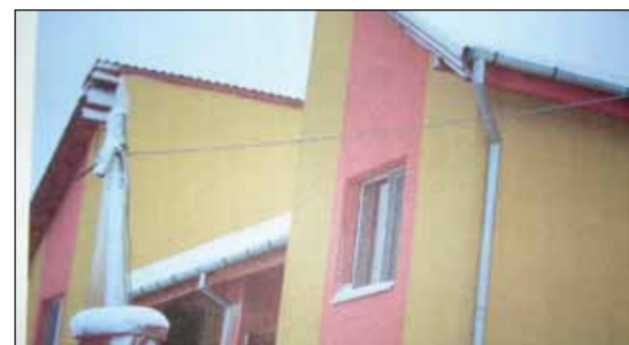
Casa din Timișoara a fiilor primarului Toța