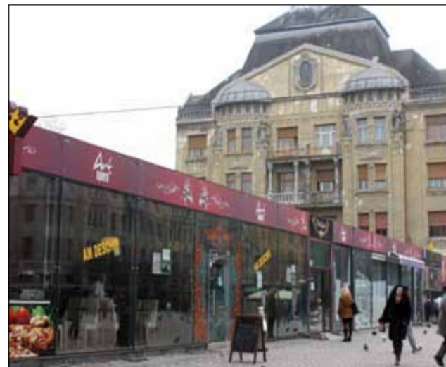
Timișoreni sunt revoltați că acvariul din centru nu a fost demolat

Dosarul lui în baza căruia s-a avertat monstruoasa construcție îi lipseau câteva documente importante, printre care Planul Urbanistic Zonal, avizul Comisiei de Monumente și dovada organizării unei dezbatere