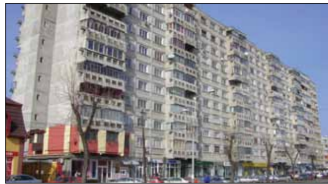
În Șagului un proprietar și-a vopsit balconul cum a vrut