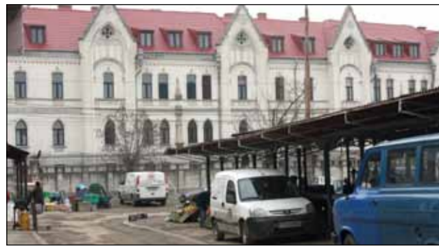
Piața agro din Bălcescu este ca o carie în țesutul urban