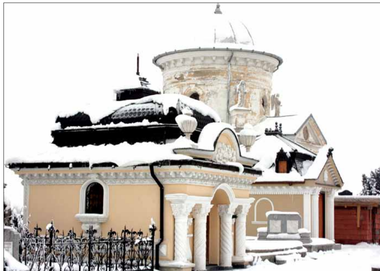
Cimitirele au devenit adevărate cartiere rezidențiale pentru țiganii care investesc zeci de mii de euro în palatele mortuare

Un mic ajutor vine de la Casa de Pensii, dar doar pentru cei care au pensii de stat. Familiile rămase în urma acestei categorii primesc 2.000 de lei ajutor de înmormântare, însă pentru restul este un efort financiar greu de suportat.