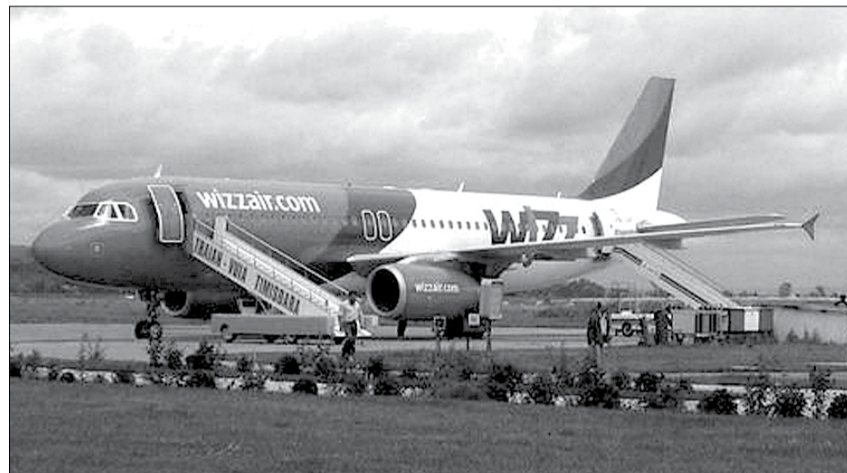
WizzAir are o cifră de afaceri de aproape 100 de milioane de euro

Proiectul fuziunii aeroporturilor din Arad și Timișoara, dezavuat complet de autoritățile din capitala Banatului, a fost repus pe tapet în ultima perioadă, după ce edilii arădeni au anunțat că sunt în negocieri avansate cu reprezentanții companiei aeriene Wizz Air pentru ca aceștia să-și mute baza operațională de la Timișoara la Arad. În acest fel - spune directorul comercial al aeroportului din Arad, Ovidiu Moșneag - s-ar prelua de la Timișoara aproape 400.000 de pasageri pe an, adică clienții fideli ai Wizz Air, iar această lovitură de afaceri ar duce rapid baza aeriană pe profit și ar putea constitui un prim pas către mult dorita fuziune cu Timișoara. Asta, în ciuda faptului că, deocamdată,