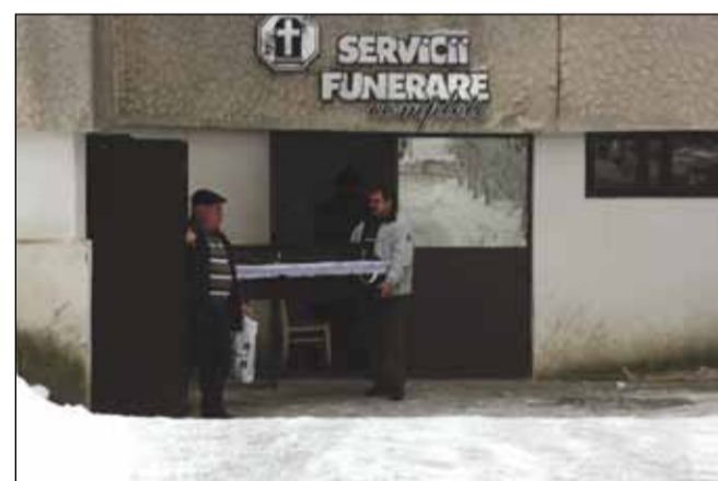
Serviciile de pompe funebre au taxe exorbitante