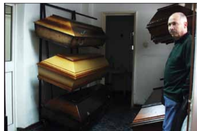
Cel mai ieftin coșciug costă 400 de lei