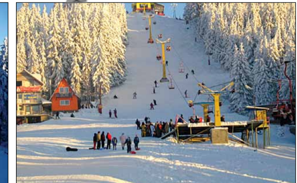
În masivul Parâng urmează să fie amenajate 5 pârtii noi cu o lungime totală de 23 de km