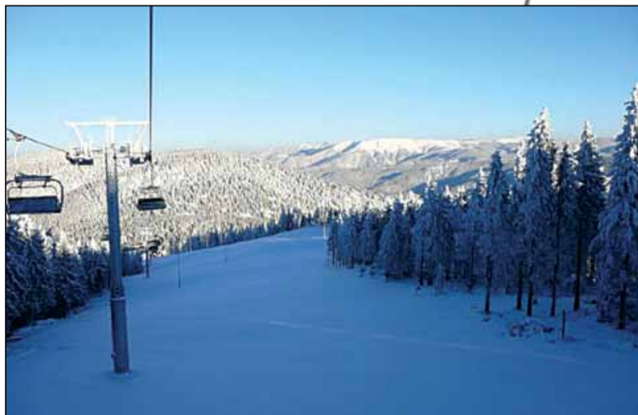
Pârția nouă de la Arieșeni a fost dată în folosință anul acesta

Și despre Pasul Vulcan nu mai de bine. La sfârșitul aceste luni se va inaugura prima telegondolă cu o lungime de 3099 m. Dispune de 72 de cabine, fiecare cu 8 locuri și are o capacitate de urcare de 1800 persoane pe oră și o durată de transport de aproximativ 8