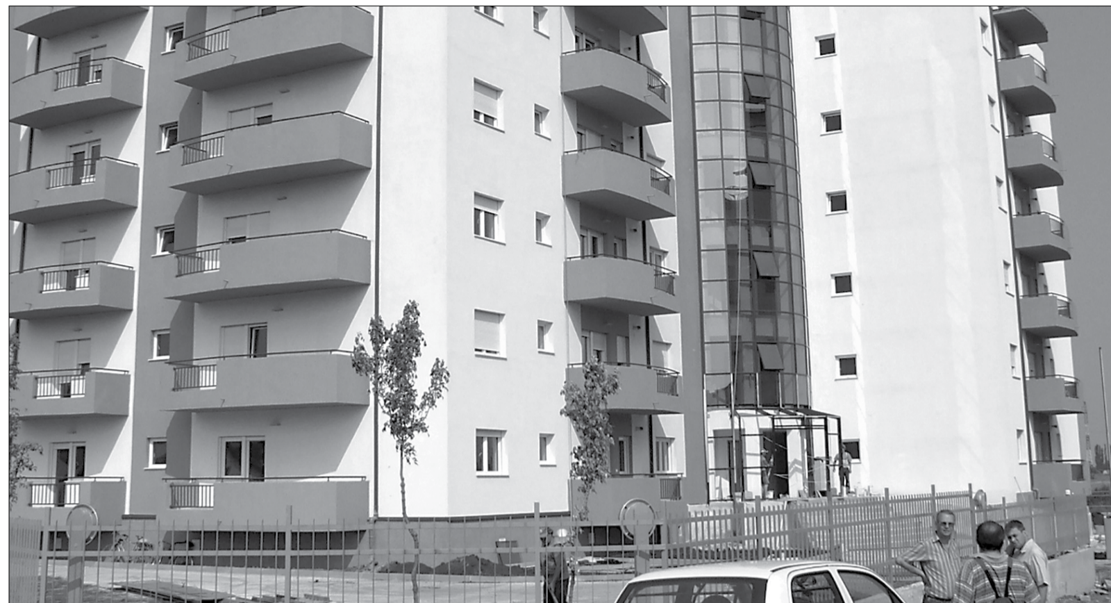
Condițiile prohibitive de creditare împiedică timișorenii să achiziționeze locuințe

GHEORGHE ILAȘ gigi.ilas@opiniatimisoare.ro