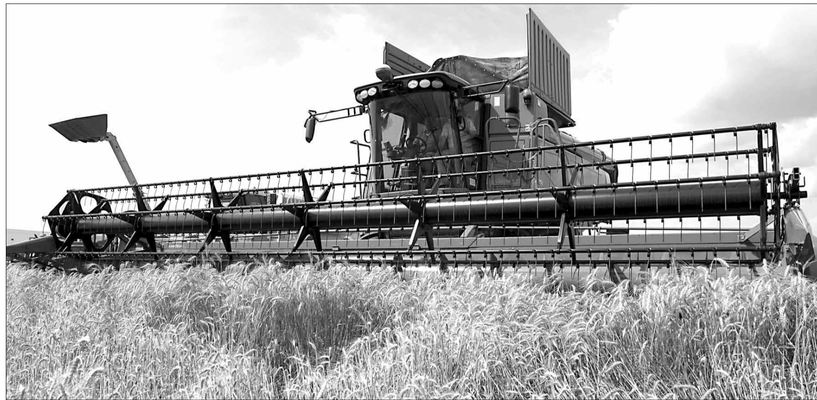
Asemenea imagini încep să devină tot mai rare pe terenurile agricole din județul Timiș

Suprafața totală a Timișului este de aproape 870.000 hectare, din care teren agricol reprezintă aproape 700.000 hectare. „20 la sută din suprafață este rămasă neînsămânțată, 102.299 hectare. E o chestiune destul de neplăcută pentru noi ca și județ. Aceste suprafețe sunt deținute în special numai pentru a primi subvenții. Majoritatea sunt străini care nu lucrează, sunt firme din afara județului sau a țării, care au cumpărat teren cu mult timp în urmă, pentru că au aflat că se vor primi subvenții și au profitat de situație. Se cumpără sute de hectare cu o sută de mărci. Nu avem statis-