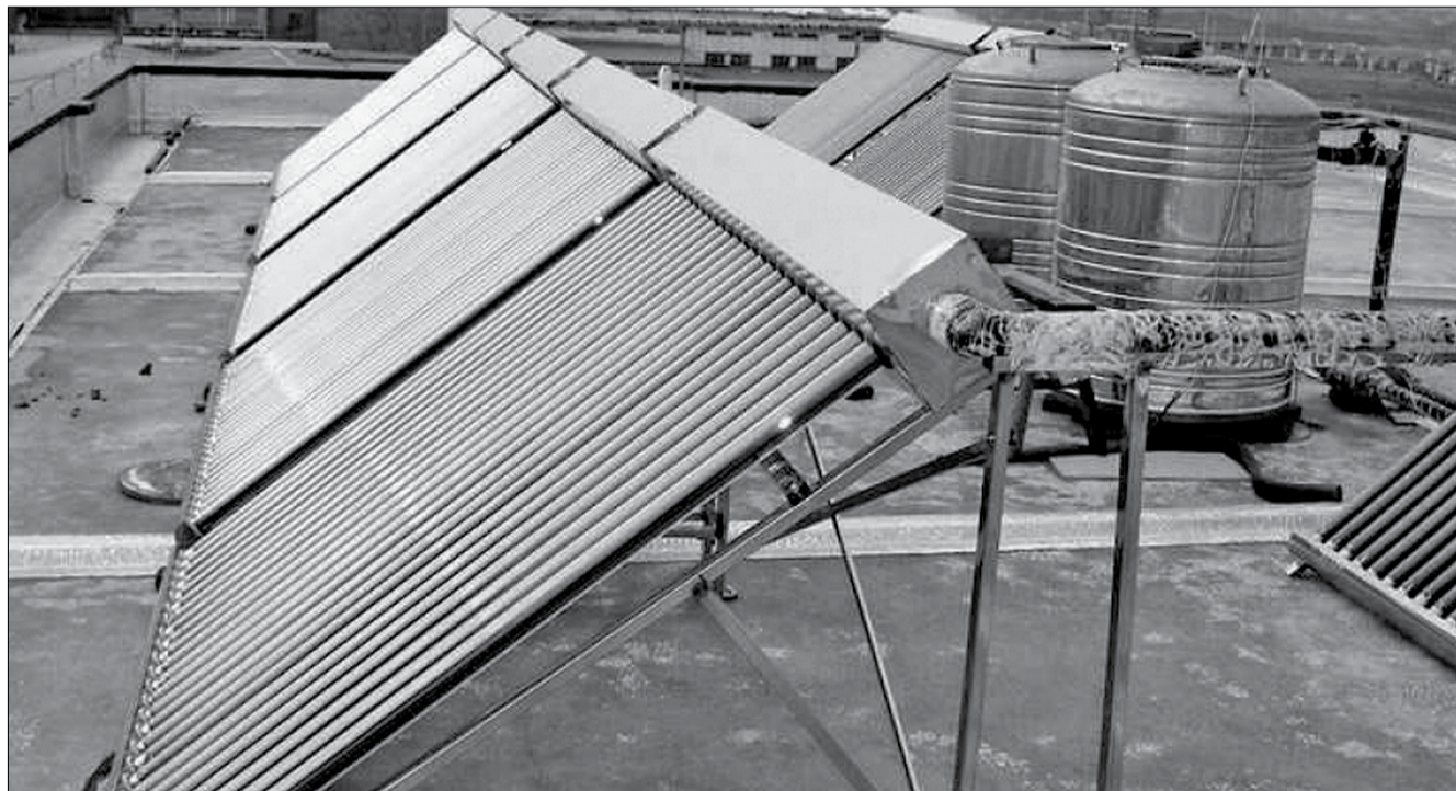
Finanțarea nerambursabilă a fost obținută de personalități timișene cu bani