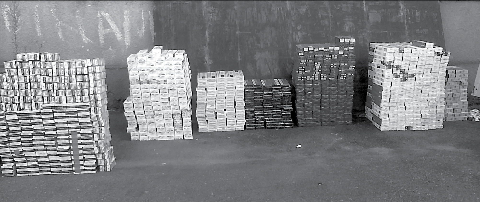
Autoritățile confiscă aproape în fiecare zi sute de cartușe cu țigări de contrabandă. Traficanții riscă, mai nou, ani grei de pușcărie