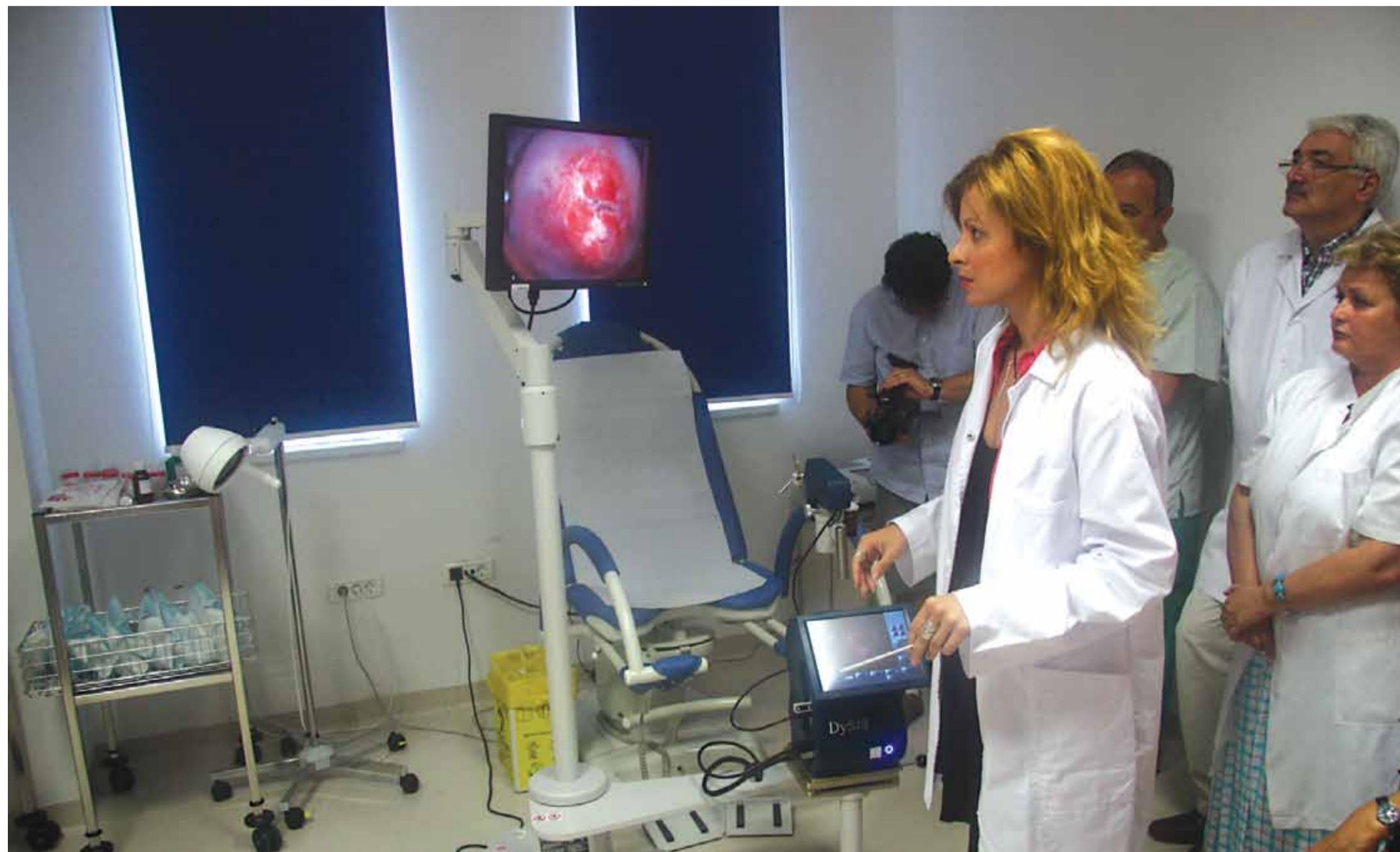
Specialiștii greci le-au explicat medicilor timișoreni care sunt avantajele investigațiilor realizate cu video colposcopul de la Spitalul privat „Athena”

Dacă doriți o astfel de investigație, trebuie să știți că puteți beneficia de ea fie cu trimitere medicală, fie fără, în cazul în care doriți doar un control de rutină. Când ajungeți la cabinet, singurul lucru pe care trebuie să-l faceți este să fiți cât mai relaxată pe masa ginecologică. Se va fixa un specul pe aparat care se va menține fix, se va pulveriza acid acetic uniform în zona respectivă și timp de 3 minute aparatul stochează imaginile. Pe baza acestor imagini, se formează o „hartă” cu diferite culori; aceste culori sunt în funcție de intensitatea reacției față de acidul acetic și gra-