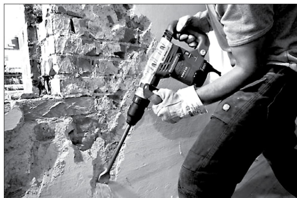
Muncitorii necalificați pot aplica pentru un loc de muncă în construcții, la demolat clădiri

Deocamdată, oferta de locuri de muncă pentru șomerii cu studii superioare este destul de redusă, respectiv sub 5% din totalul posturilor vacante.