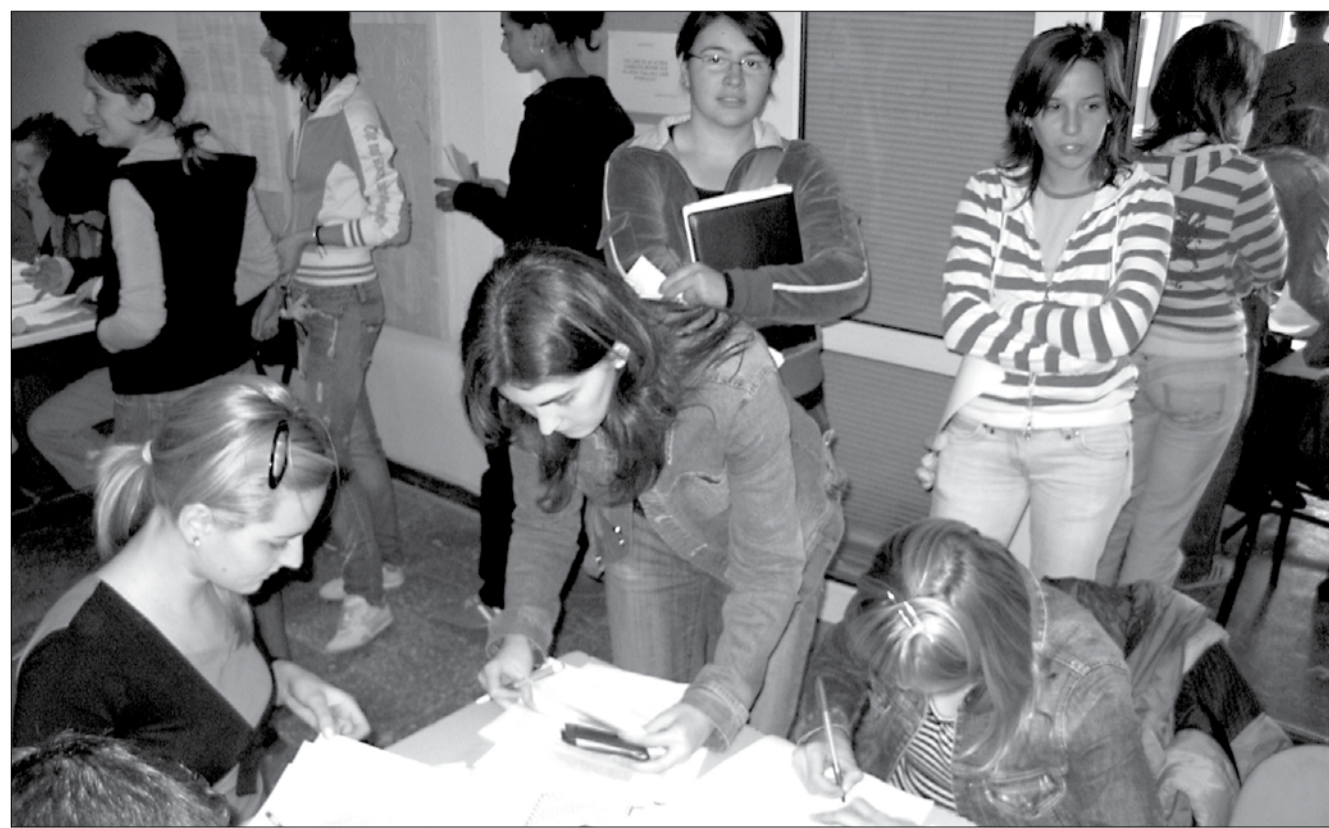
Absolvenții de liceu au luat cu asalt punctele de înscriere la facultăți

Ca și în alți ani, la Universitatea de Vest, facultățile cu căutare în rândul tinerilor sunt cea de Drept și cea de Științe Politice, Filosofice și Științe ale Comunicării. La Drept de exemplu, pentru cele 70 de locuri bugetate s-au înscris până în 21 iulie 630 de candidați, ceea ce înseamnă o concurență de 9 pe un loc. O concurență și mai mare se înregistrează la Relații Internaționale și studii europene sau Științe ale comunicării acolo unde se vor lupta 469 pe 35 de locuri bugetate (concurență de 13 pe un loc), respectiv 579 de candidați pe 43 locuri fără taxă (concurență de 14 pe