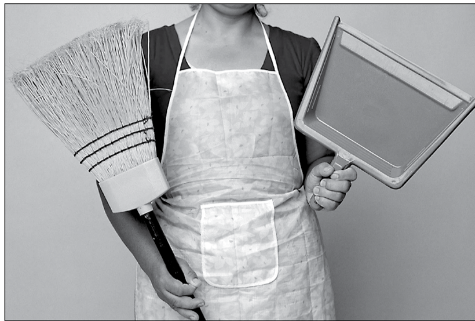
În prezent, femeile de serviciu sunt angajate de asociații în baza unei convenții civile

Problemele nu vor apărea în viitorul apropiat, ci peste 4-5 ani, când femeile de serviciu vor fi luate la „puricat” de autorități