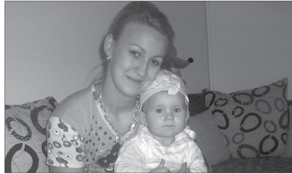
Pentru Remus Ric

Dacă stăm și calculăm ce bani mai primesc mamele timișorene de la 1 iulie 2010, se poate spune că România nu stimulează deloc natalitatea. Sau, de ce nu, se poate spune că familiile din clasa medie, dacă țara noastră are așa ceva, nu sunt încurajate să aducă pe lume bebeluși. Sumele de bani care se dau mamelor s-au redus la doar două indemnizații, din care una a fost tăiată cu 15 procente. Înainte de 1 iulie, fiecare mamică primea de la stat 230 de lei indemnizație pentru primii patru copii născuți, alți 150 de lei - trusou o singură dată, precum și o alocație de 200 lei pe lună timp de doi ani de zile, precum și 85% din veniturile câștigate în ultimele 12 luni. "De la 1 iulie, o dată cu intrarea în vigoare a Legii 118/2010 cuantumul indemnizației de