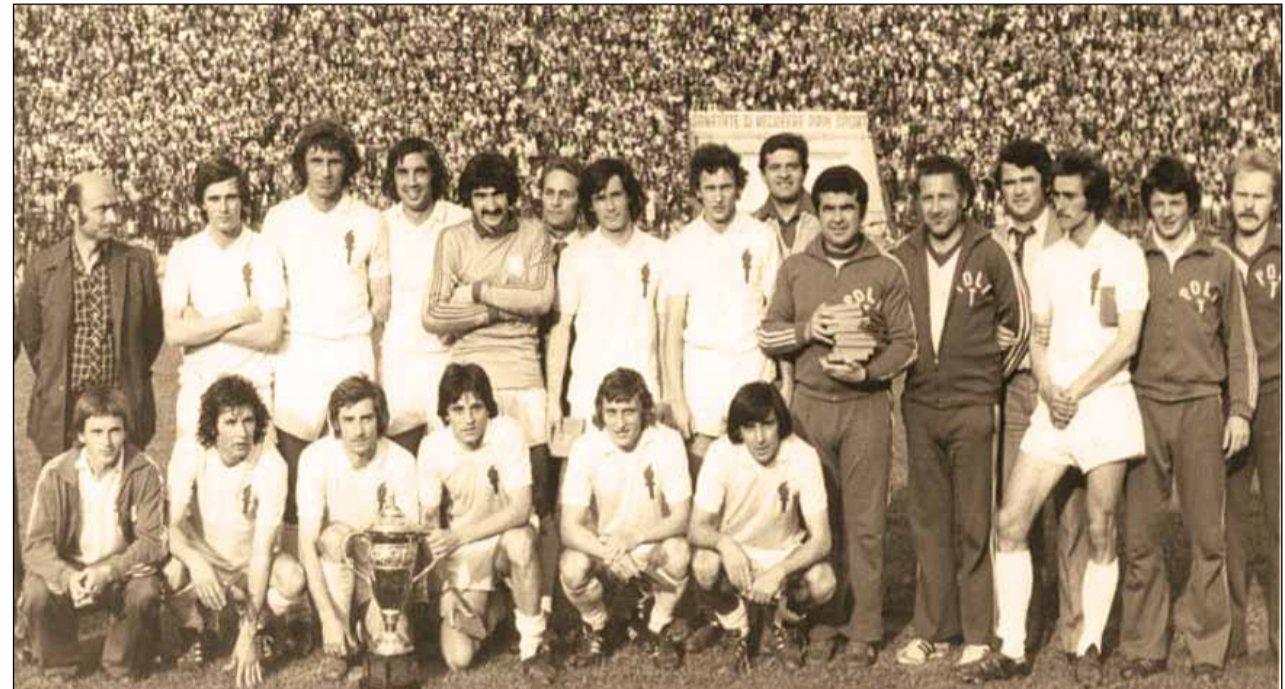
Echipa din 1980 care cucerea pentru prima dată, și singura, Cupa României, învingând Steaua în finală

Au trebuit să treacă 12 ani până la sărbătorirea