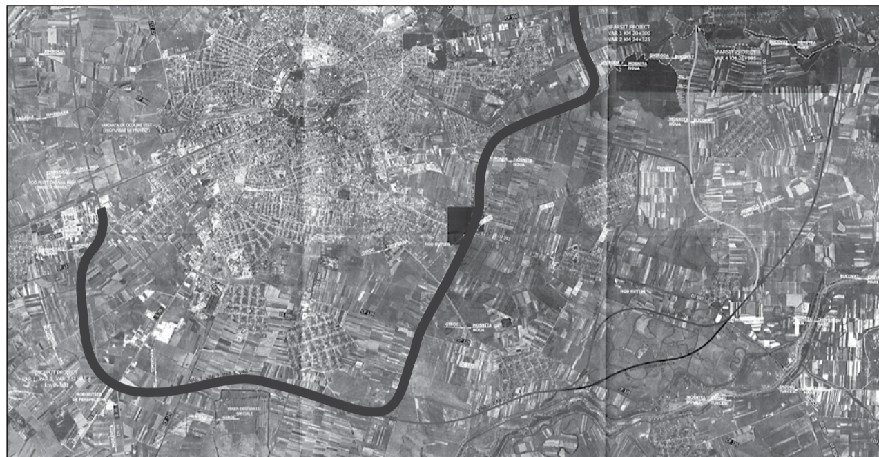
Deși finanțarea este europeană, CLT a ales varianta cea mai ieftină

„Proiectantul a ales alt tronson din cele patru, dar prima este cea mai ieftină. Cea de-a treia variantă ar costa cu 17 milioane de euro în plus. Trebuie să luăm în considerare și faptul că inelele Timișoarei nu sunt închise, iar foarte mulți timișoreni se vor folosi de această centură pen-